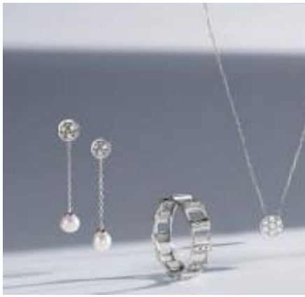
【ヴァンドーム青山】