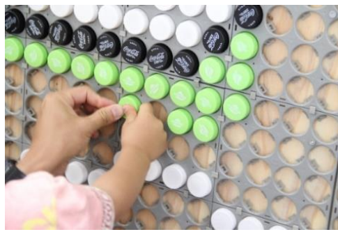
キャップアート制作過程