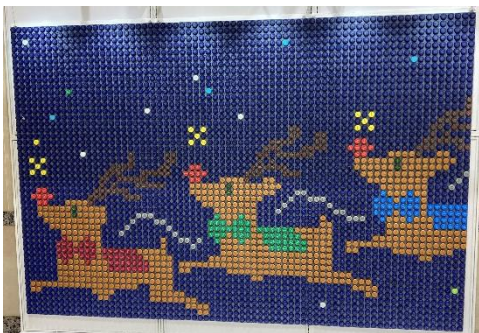
2023年制作デザイン一例