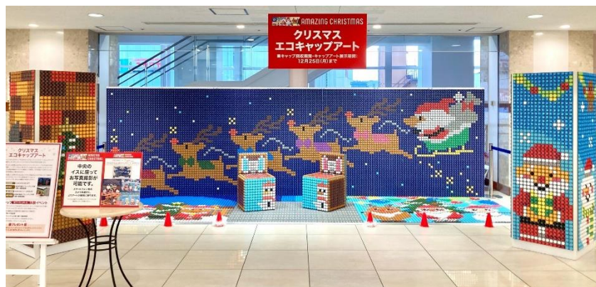
2023年制作デザイン一例