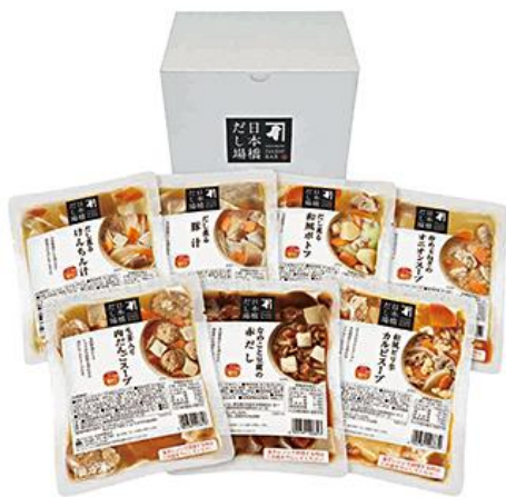
初登場【にんべん】 日本橋だし場だしスープ 5,400円(税込)