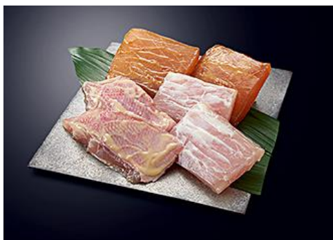
三浦【羽床総本店】 京急百貨店限定ギフト 6,480円(税込)