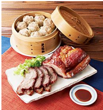
横浜【尾島商店】 焼豚焼売詰合せ 5,325円(税込)