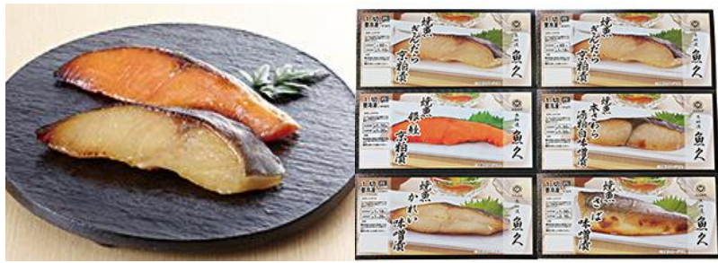
初登場【京粕漬魚久】 レンジ対応焼魚詰合せ6切 6,048円(税込)