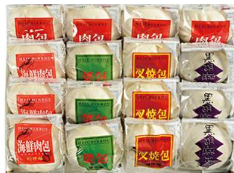
中華饅頭シリーズセット 5,400円（税込）