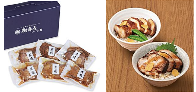
初登場【鶴舞屋】 国産煮豚・煮鶏詰合せ 5,400円(税込)