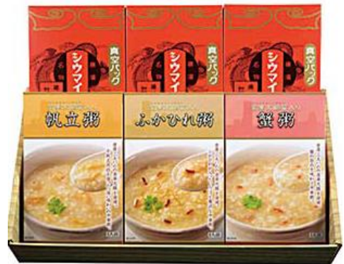
シウマイ・中華粥詰合せ 3,400円(税込)