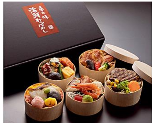
【別府 割烹平家】 海鮮わっばめし 6,480円(税込)