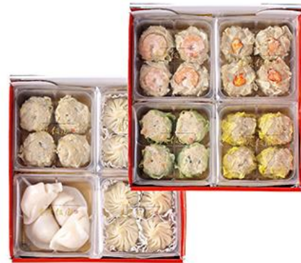
「汽笛」点心セット 7種 5,400円（税込）