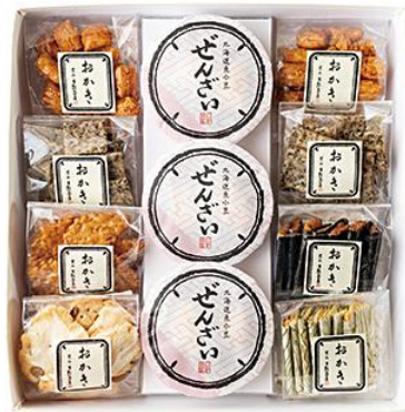
葉山【葉山 日影茶屋】 おかき・ぜんざい詰合せ 11個入 4,320円(税込)