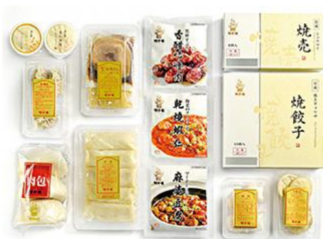
バラエティセット 10,800円（税込）

広東料理の老舗聘珍樓は、創業以来伝統の本格中華で、吟味した新鮮な素材の旨味を最大限にひきだし、一品一品を丁寧に仕上げた味です。