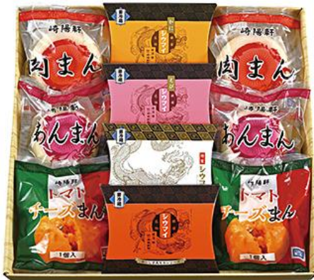
崎陽軒シウマイ・中華まん詰合せ 5,750円(税込)

明治41年創業の老舗崎陽軒は、名物シウマイをはじめとした横浜のおいしさを詰合せました。