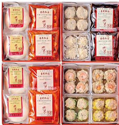
「キング」点心料理セット 11種 10,800円（税込）