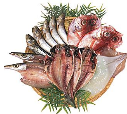
横須賀【佐島 石川水産】 ひもの詰合せ 4,860円(税込)