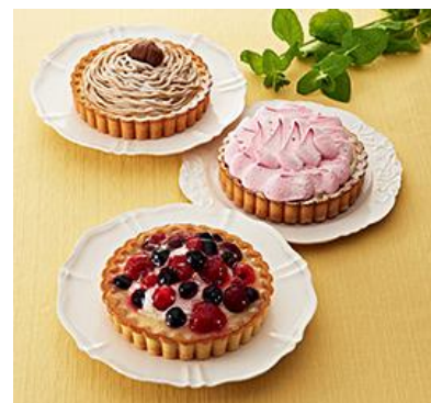
【リストランテ アルポルト】 タルト詰合せ 5,940円(税込)