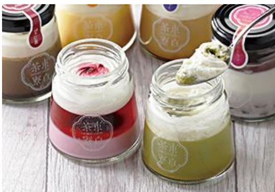
【東白茶寮】 冬のプリンバラエティセット 5,400円(税込)