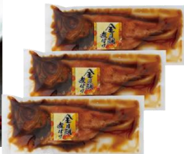
初登場 【静岡伊豆高原 俵家】