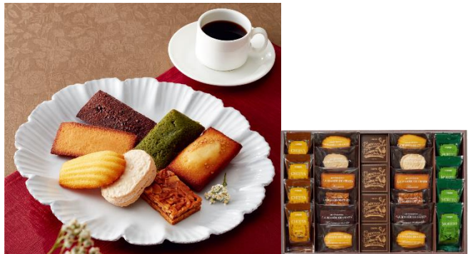
【葉山 ラ・マーレ・ド・チャヤ】