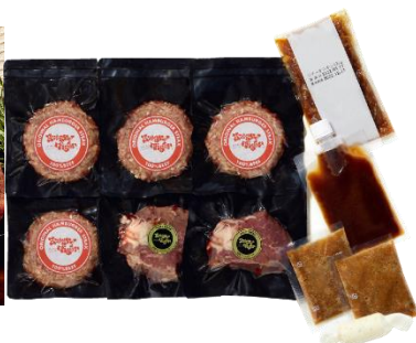
オリジナルハンバーグと国産フィレスステーキ