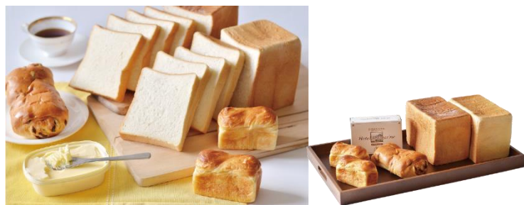
初登場 【金谷ホテルベーカリー】 パン4種とマーガリンのセット 5,400円（税込）