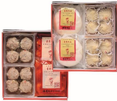
点心料理セット「ジャック」

四川料理の銘店<重慶飯店>を代表する料理「四川麻婆豆腐」「海老のチリソース」や人気の点心など、ご家庭で味わえる詰合せを各種ご用意しました。