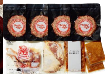
オリジナルハンバーグとみつせ鶏