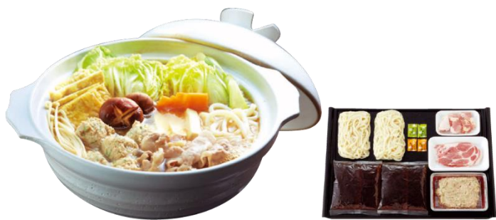
初登場 【季節料理 門】 京のちゃんこ鍋セット 5,400円（税込）