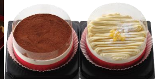
初登場 【リストランテ・アルポルト】