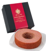
初登場【神戸うららか】 ジュエリーバウム2個セット 5,400円（税込）