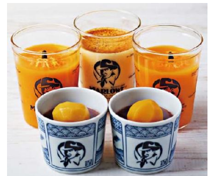
栗水ようかんと有田みかんの ジュレセット 5,930円(税込)