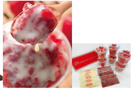
初登場 宮城 【燦燦(さんさん)園】いち氷 5,400円(税込)