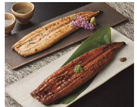
【薩摩川内鰻】 鹿児島県産鰻長蒲焼・白焼きセット 8,100円(税込)