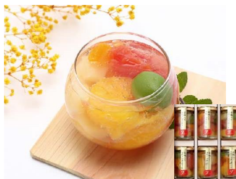
初登場【ふみこ農園】 若桃入りフルーツコンポート6本 4,536円(税込)