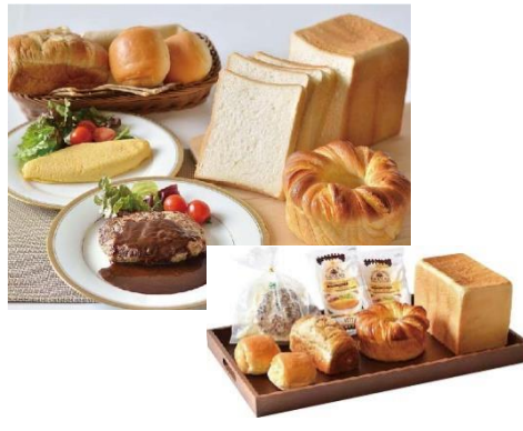
初登場 栃木 【金谷ホテルベーカリー】 パンと総菜セット 7,560円(税込)