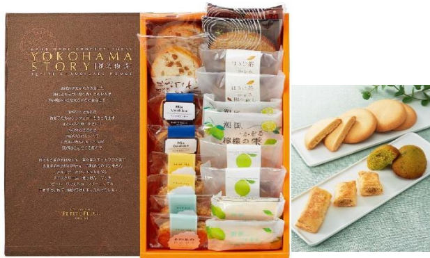
京急百貨店限定 横浜物語 3,240円(税込)