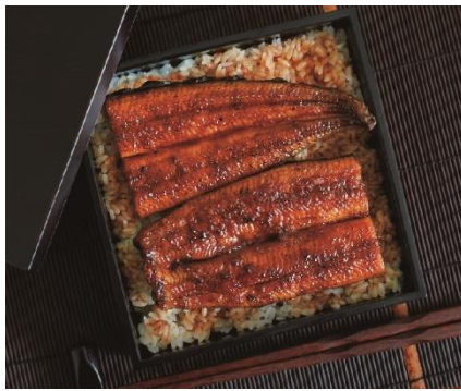
【大和養魚】浜名湖うなぎ長蒲焼 6,480円(税込)

うなぎの蒲焼，白焼，うなぎめしなど，京急百貨店がおおすすめするうなぎを取り揃えました。温めるだけの簡単な調理でお召し上がりいただけるので，一人暮らしをされているご家族にもおすすめです。