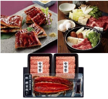
初登場 鹿児島・宮崎 鹿児島県産うなぎ蒲焼き・宮崎牛セット 10,800円(税込)