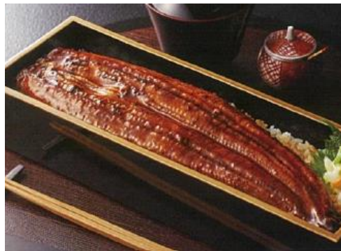
【薩摩川内鰻】 鹿児島県産特大鰻長蒲焼4尾セット 16,200円(税込)