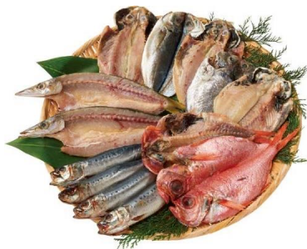
ひもの詰合せ 4,860円(税込)