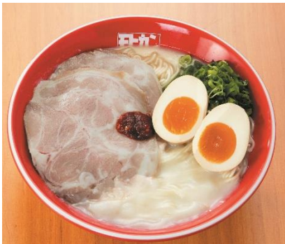
極上豚骨モヒカンらーめん 煮卵入り (1杯)・・・950円(税込)

湯気まで美味しい！九州豚骨！コクがあるのにさっぱりな名物スープ【福岡県/モヒカンらーめん】