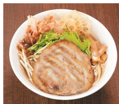
いいとこ鶏ラーメン (1杯)・・・1,000円(税込)