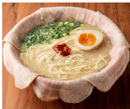
特製こぼれチャーシュー麺 (1杯)・・・1,250円(税込)