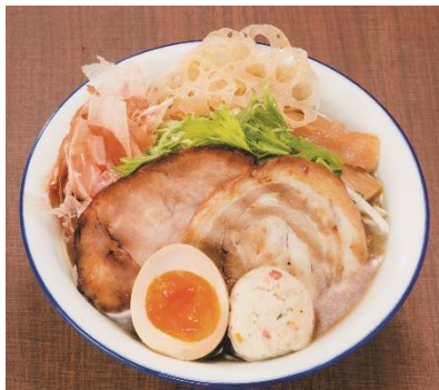
【京急百貨店オリジナル】 最上のQラーメン <各日限定100杯> (1杯)・・・1,300円(税込)

新登場！最後の一滴まで飲み干せる！鶏出汁塩ラーメン！【鹿児島県/サカノウエユニーク】