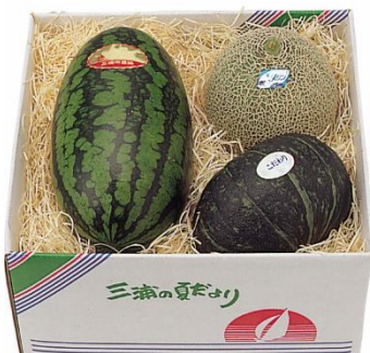
三浦【三浦市農協】 三浦の夏だよりマリンセット 4,860円(税込)