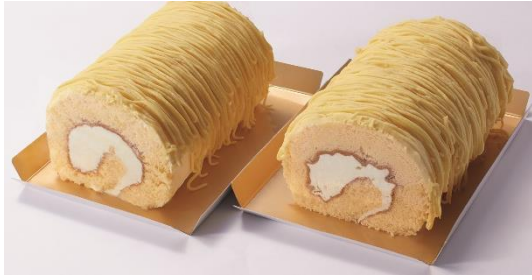
海老名【ロリアン洋菓子店】 黄金のモンブランロール2本入り 3,564円(税込)