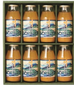
茅ヶ崎【湘南工房】 湘南みかんジュースセット 4,320円(税込)