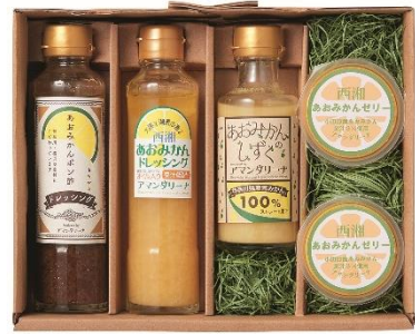
横浜【アマンドリーナ】 あおみかンドレッシングギフト 4,800円(税込)