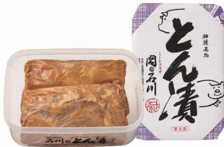
【ミートプラザ肉の石川】 とん漬け 10枚入 6,156円(税込)