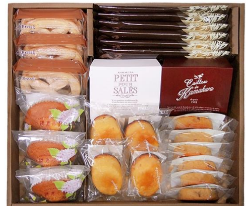
サマーギフトプレミアム 2021 6,372円（税込）