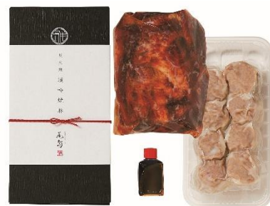
横浜【尾島商店】 焼豚焼売詰合せ 4,979円(税込)