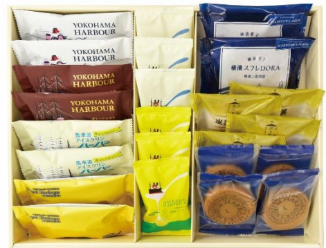
ハーバーワールドサマープレミアム 4,104円（税込）