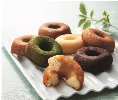
三浦【ミサキドーナツ】 京急百貨店オリジナルセット 3,780円(税込)