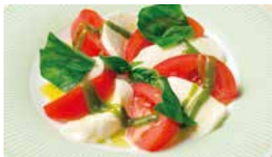
カプレーゼ 600円 (税込660円)