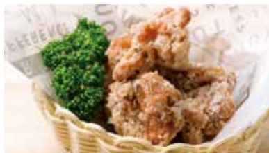
フライドチキン 430円 (税込473円)