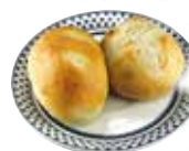
パン 300円 (税込330円)