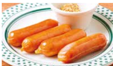
ソーセージ (4本) 350円 (税込385円)