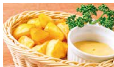
フライドポテト 380円 (税込418円)