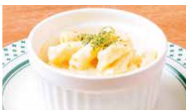
マッケンチーズ 350円 (税込385円)