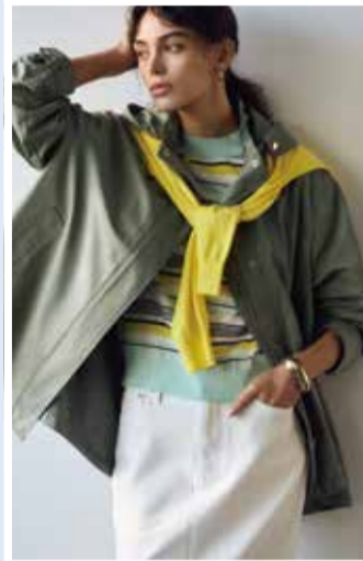
【23区】 ①ライトツイルコート.....税込39,600円 ■4階=婦人服売場【オンワード・クロゼットセレクト】