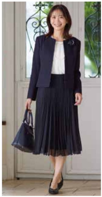
【リフレクト】 ①ジャケット.....税込40,920円 ①インナー.....税込14,960円 ①スカート.....税込19,910円 ■4階=婦人服売場【リフレクト】