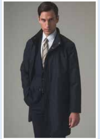
【GOTAIRIKU】 ①ラストードビーメモリーラミネーションコートスタンドカラー(24年モデル).....税込75,900円 ■6階=紳士服売場【オンワード・クロゼットセレクト】

春のコートご試着キャンペーン ■1月16日(木)~2月19日(水) ■3・4階=婦人服売場、6階=紳士服売場