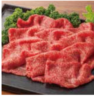
【アイ・ミート】 ①黒毛和牛モモ すき焼き用切落し (100g).....税込800円 ■デリーフーズマーケット