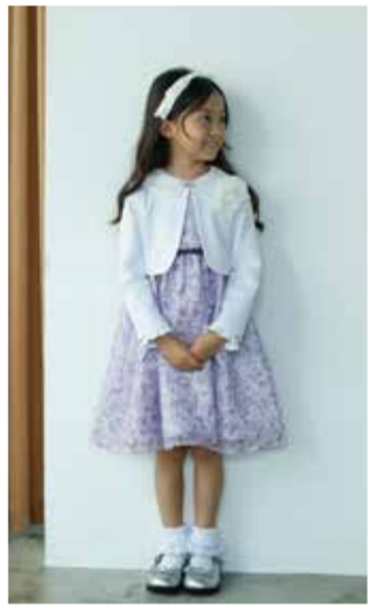
【ベベ】 ①ワンピース.....税込33,000円 ①ジャケット.....税込15,400円 ■5階=子ども服売場【ベベ】

★お買上げプレゼント★ 期間中、3~7階にてセレモニー対象商品を1レシート30,000円以上お買上げの方に「京急百貨店レストランギフトカード(1,000円分)」をプレゼント。