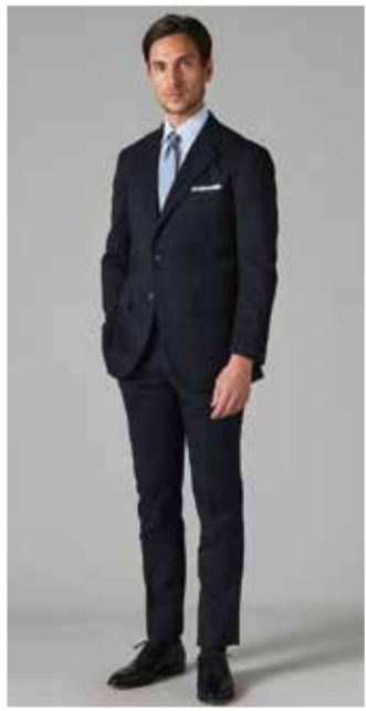
【GOTAIRIKU】 ①ストレッチギャバジン スーツ.....税込59,400円 ■6階=紳士服売場【オンワード・クロゼットセレクト】

★お買上げプレゼント★ 期間中、3~7階にてセレモニー対象商品を1レシート30,000円以上お買上げの方に「京急百貨店レストランギフトカード(1,000円分)」をプレゼント。