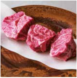
【日本橋日山】 ①黒毛和牛牛スネ肉シチュー用 (100g).....税込480円 ■デリーフーズマーケット