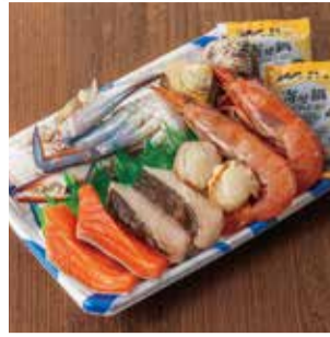
【築地 中島水産】 ①海鮮鍋セット(1パック) (各日限定30パック).....税込1,299円 ■デリーフーズマーケット