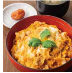
【鶏三和 イートイン】 ①名古屋コーチン親子丼(1人前) (各日限定30食).....税込1,078円 ■惣菜売場