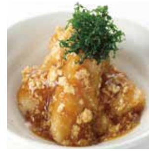
【まつおか】 ①長芋の鶏そばろあんかけ (100g).....税込378円 ■惣菜売場