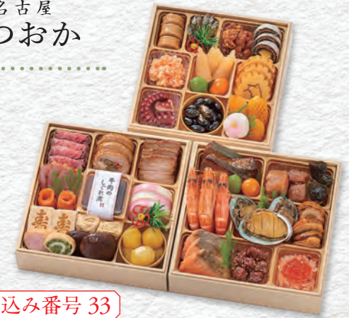
お申し込み番号 33 和風おせち 三段重 縦18.2×横18.2×高さ4.0cm×3段 / 消費期限:冷蔵1月1日(水・祝) 〈税込〉23,760円 9809033 持帰 配送