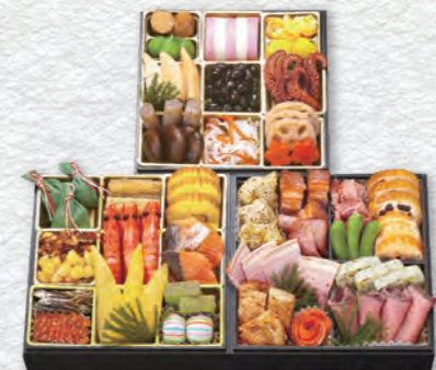
お申し込み番号 36 和洋風三段重 燦 縦19.8×横19.8×高さ4.6cm×3段 消費期限:冷蔵1月1日(水・祝) 〈税込〉19,980円 9809036 持帰 配送