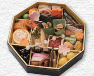
お申し込み番号 42 福 和風おせち一段 縦24.1×横24.1×高さ6.1cm×1段 消費期限:冷蔵1月1日(水・祝) 〈税込〉13,500円 9810042 持帰 配送