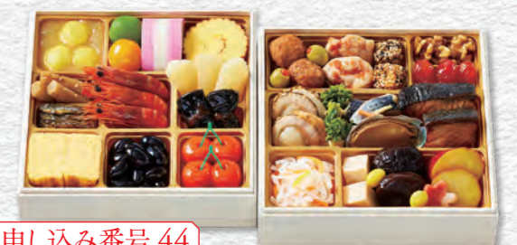
お申し込み番号 44 桜春 縦19.5×横19.5×高さ4.5cm×2段 / 消費期限:冷蔵1月1日(水・祝) 〈税込〉13,824円 9810044 持帰 配送