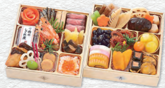
お申し込み番号 34 和風おせち 二段重 縦18.2×横18.2×高さ4.0cm×2段 / 消費期限:冷蔵1月1日(水・祝) 〈税込〉14,580円 9809034 持帰 配送