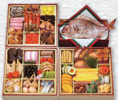
お申し込み番号 35 和風三段重(鯛付)鶴亀 縦22.0×横22.0×高さ5.0cm×3段+鯛重 消費期限:冷蔵1月1日(水・祝) 〈税込〉27,000円 9809035 持帰 配送