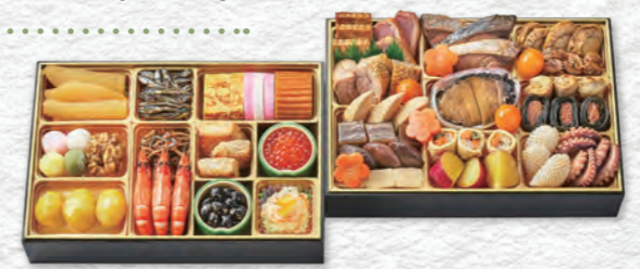
お申し込み番号 38 和の華二段重 縦18.4×横27.5×高さ4.0cm×2段 / 消費期限:冷蔵1月1日(水・祝) 〈税込〉24,840円 9810038 持帰 配送