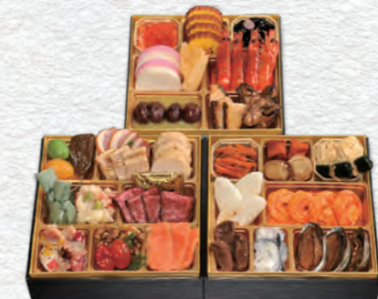
お申し込み番号 45 和洋風おせち三段重 縦19.6×横19.6×高さ5.0cm×3段 / 消費期限:冷蔵1月1日(水・祝) 〈税込〉24,840円 9810045 持帰 配送