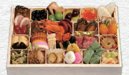
お申し込み番号 46 和洋風おせち一段重 縦22.4×横32.6×高さ5.3cm×1段 / 消費期限:冷蔵1月1日(水・祝) 〈税込〉16,200円 9810046 持帰 配送