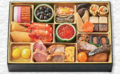
お申し込み番号 39 和の華一段重 縦18.4×横27.5×高さ4.0cm×1段 / 消費期限:冷蔵1月1日(水・祝) 〈税込〉12,960円 9810039 持帰 配送