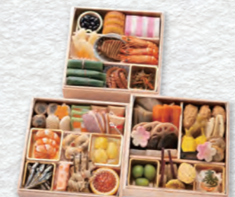
お申し込み番号 40 竹 和風おせち三段重 縦19.7×横19.7×高さ5.1cm×3段 消費期限:冷蔵1月1日(水・祝) 〈税込〉32,400円 9810040 持帰 配送