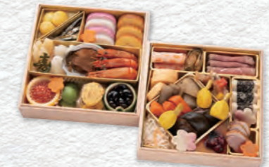
お申し込み番号 41 梅 和洋おせち二段重 縦19.7×横19.7×高さ5.1cm×2段 消費期限:冷蔵1月1日(水・祝) 〈税込〉23,760円 9810041 持帰 配送