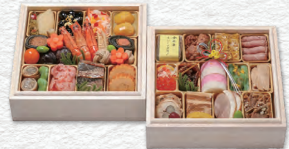
お申し込み番号 31 おせち料理 六寸角二段重 縦20.7×横20.7×高さ5.0cm×2段 / 消費期限:冷蔵1月1日(水・祝) 〈税込〉24,840円 9809031 持帰 配送