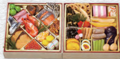
お申し込み番号 37 和風二段重 富士 縦22.0×横22.0×高さ5.0cm×2段 消費期限:冷蔵1月1日(水・祝) 〈税込〉13,500円 9809037 持帰 配送