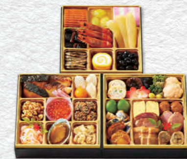
お申し込み番号 43 陽月花 縦19.5×横19.5×高さ4.5cm×3段 / 消費期限:冷蔵1月1日(水・祝) 〈税込〉19,440円 9810043 持帰 配送