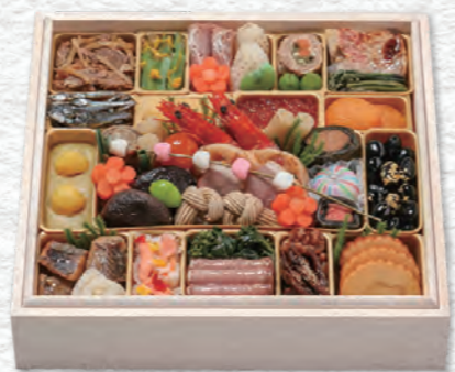
お申し込み番号 32 おせち料理 八寸角一段重 縦26.8×横26.8×高さ5.0cm×1段 / 消費期限:冷蔵1月1日(水・祝) 〈税込〉19,980円 9809032 持帰 配送