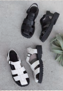
→タンク底 グルカサンダル 税込13,200円

毎回ご好評をいただいている【Recipe】の期間限定ポップアップ。本革のやわらかな履き心地と、この夏を彩る一足を、ぜひ店頭でご体感ください。