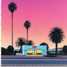
↑ Eternal Twilight 税込264,000円

永井博が描くのは、私たちがいつかどこかで見た、あるいは心の奥で憧れ続ける「永遠の夏」です。本展『Daylight Twilight』では、光のドラマを鮮やかに切り取った版画作品を展示いたします。